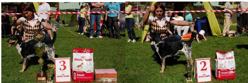
Krajská výstava Děřichov - Chudobka Anibob 3. BIS, 2. BIS veterán