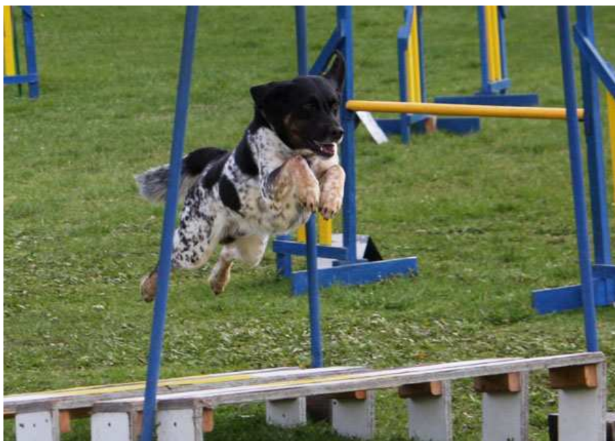
A Však Czech Originál

Pro ty, kdo jsou začátečníci jako my, stručný popis toho co se na závodech děje: Předem jsme si museli vyřídit výkonnostní průkaz. O ten si zažádáte na www.kacr.cz . Stojí stokorunu a s ním můžete na oficiální závody. Když se stanete i členem Klubu agility ČR, tak pak máte levnější startovné na závodech. Z toho logicky plyne, že další krok je přihlásit se k samotnému závodu a zaplatit startovné.