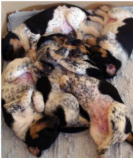
C z Luční ulice