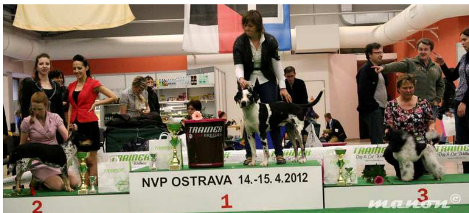
NVP Ostrava - Chudobka Anibob 2. BIG, 2. BONB, 4. nejlepší veterán výstavy