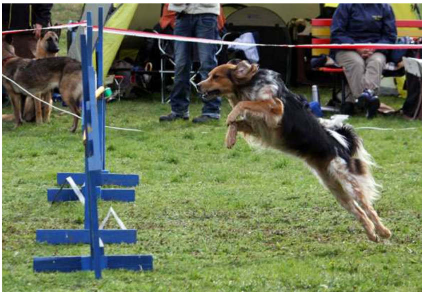
Delfík Strakatý samet

V průběhu jsme odchytili pravidla - co je chyba, co je odmítnutí, za co hrozí diskvalifikace. Když pojedete na závody bez party kamarádů, je dobré si vše nastudovat předem. My měli štěstí, že mezi námi byli zkušenější agilitaři a vysvětlovali nám, za co byl kdo diskvalifikován.