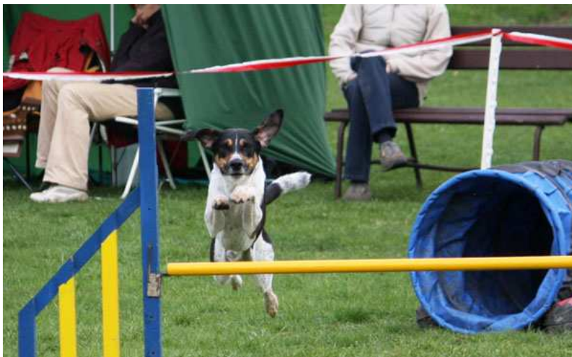
Lusk z Česlova

Co z toho všeho plyne? Agility je prima, na závody asi jezdit nebudeme, ale na Kutnohorský groš se příští rok jistě přihlásíme.