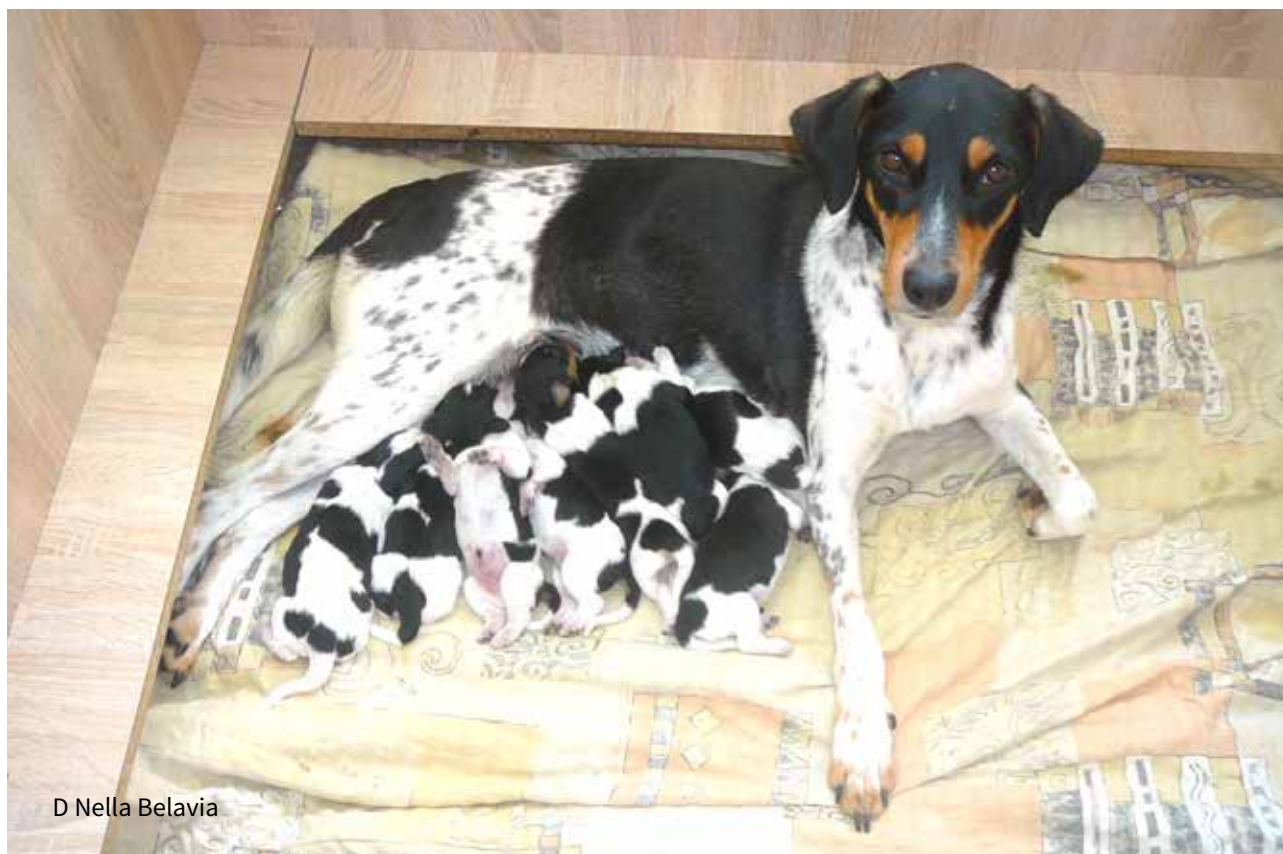
D Nella Belavia